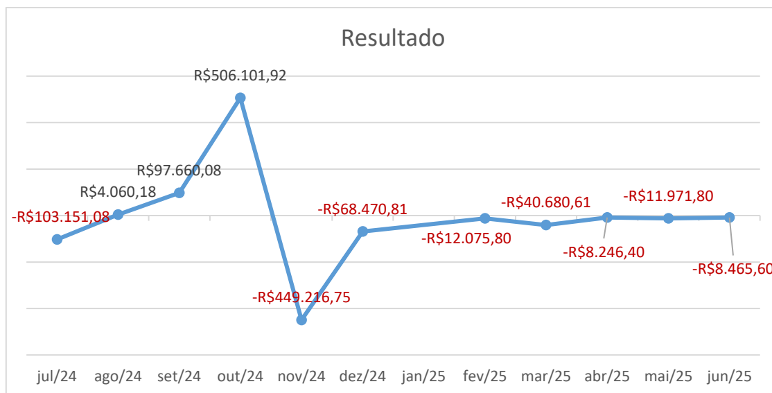
Figura 3 - Resultado

Apuradas as receitas e despesas, a Recuperanda apresentou prejuízo em todos os períodos analisados.