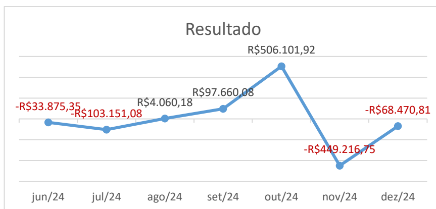
Figura 3 - Resultado

Ao analisar o demonstrativo da Figura 3, nota-se quem a Recuperanda apresentou cenários positivos nos meses de agosto a outubro de 2024: