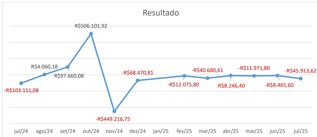
Figura 3 - Resultado

Apuradas as receitas e despesas, a Recuperanda apresentou prejuízo em todos os meses de 2025.